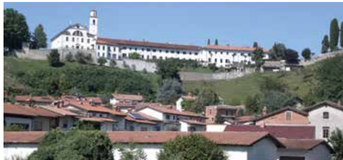
Il santuario della Castagnavizza

Torniamo in piazza Vittoria (1B) per il secondo percorso. Si prosegue per via Arcivescovado e Carducci fino a piazza De Amicis , si svolta a destra per via Formica e si giunge al Rafut . L'alternativa è imboccare sulla destra, a metà di via Carducci, via Favetti (vedi percorso 4) fino all'inizio di via Cappella (2B) , stradina in salita che sale al santuario superando il confine e dove l'antico acciottolato la rende unica e senza tempo. All'inizio della via, una targa marmorea ricorda i fratelli Edy e Pepi Rusjan (3B) : vedi percorso 1). Giunti alla sommità di via Cappella si attraversa un uliveto e si giunge alla Castagnavizza (6B) .