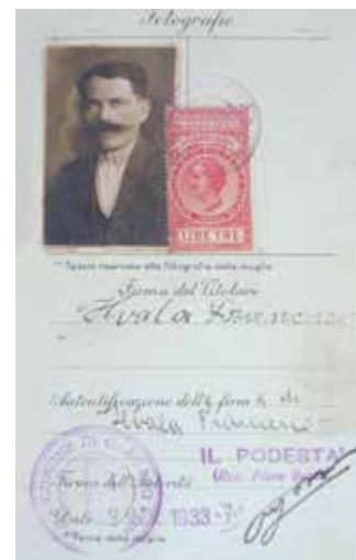
Passaporto del Regno d'Italia