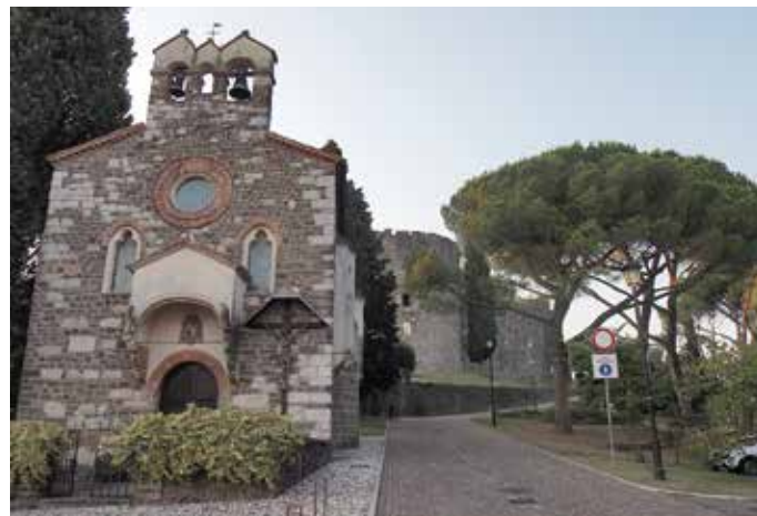
La chiesetta di Santo Spirito in Borgo Castello