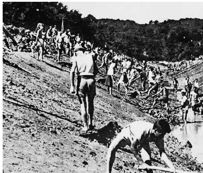
La costruzione di Nova Gorica

1950: viene costruita la galleria sotto il monte Panovec che sbocca nei pressi del valico di Casa Rossa.