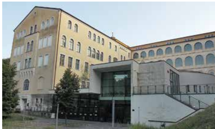
L'edificio dell'ex seminario minore

of people from Nova Gorica and other areas of Yugoslavia, flowed into Gorizia by forcing the military-controlled border crossing point, with the intention of meeting relatives and friends who had remained in Gorizia, and to buy goods that could not be found in Nova Gorica. Among the most frequently purchased items were sorghum brooms, and for this reason, that epic day is remembered as “the Sunday of Brooms”. It was one of the first seeds of the future European Community where people and goods could circulate freely. Extending from one side of Piazzale Casa Rossa is Via Emilio Cravos (6), which takes its name from the Gorizian who was shot by the Austrians on 17 November 1915 because he had shouted “Long live Italy”. After crossing the border you are in the locality of