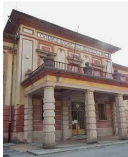
L'ex ospedale psichiatrico nel Parco Basaglia

zavijemo levo v Ulico Blaserna in Ulico Scuola Agraria , nato spet levo v Ulico Vittorio Veneto . Malo pred mejnim prehodom Šempeter, na desni strani, imamo vhod v park Basaglia (8) , ki je dobil ime po psihiatru Francu Basaglii, ki je v šestdesetih letih 20. stoletja bil pionir na področju zdravljenja duševnih bolnikov. Njegova metoda se je udejanjila v zakonu 180/78. Nekdanja umobolnica je bila zgrajena v letu 1911. Celoten kompleks se razprostira za približno 30 hektarjev. Sredi dreves in travnikov, ki obdajajo njegove stavbe, najdemo idealen kraj za razmislek in poglobitev v preteklost in prihodnost Gorice in Nove Gorice.