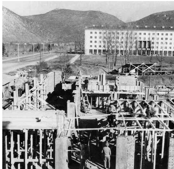
Costruzione dei "blocchi russi" a Nova Gorica tra il 1949 e il 1950

1950: the tunnel that ends near the Casa Rossa border crossing is built under Mount Panovec.