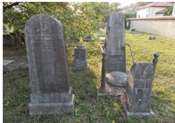
Il cimitero ebraico a Rozna Dolina-Valdirose