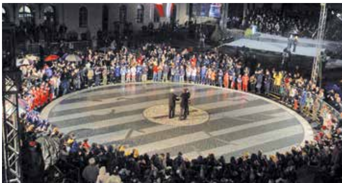
La festa del 30 aprile 2004 per l'ingresso della Slovenia nella Ue

Gorizia e Nova Gorica saranno capitale europea della Cultura nel 2025.