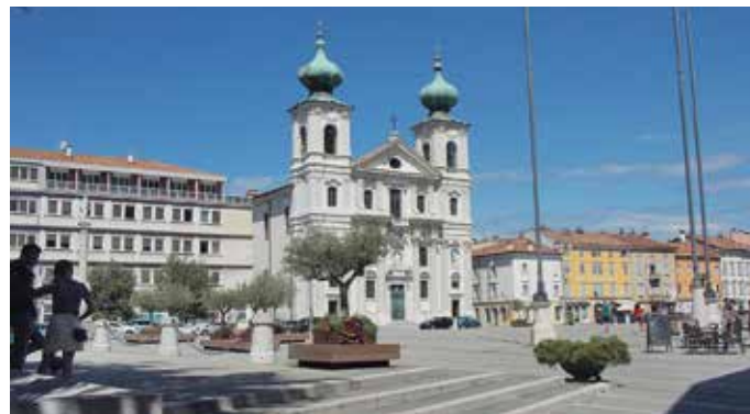
Piazza Vittoria con la chiesa di Sant'Ignazio

At the end of Via Rabatta, you enter the municipal park and the Palazzo Attems-Santa Croce (17) , the seat of the Municipality since 1907. The building was built in 1740 on a project attributed to Nicolò Pacassi. Leaving the main entrance we come to Via Garibaldi (18) , formerly Via del Teatro, thanks to the theatre (18) dating back to 1779, dedicated to Giuseppe Verdi in 1901, which overlooks it.