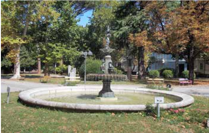
La fontana dei Giardini pubblici

At the crossroads with Corso Italia between Via 9 Agosto and Viale 24 Maggio, proceed along Via 9 Agosto in the direction of Straccis. Via 9 agosto commemorates the entry of the Italian troops into Gorizia on 9 August 1916. The street used to be called Via dell’Usina because the French company, Usine du Gaz – which produced and distributed gas from the early 20th century – was based there. The splendid Liberty building still remains, which now houses the current multiservice centre.