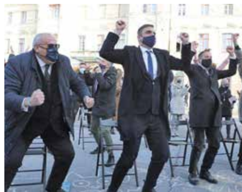
La firma dei sindaci di Gorizia e Nova Gorica per la candidatura. L'esultanza dopo l'assegnazione