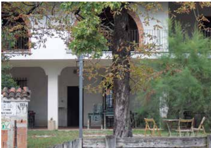
L'osteria del Bepon

il 1960 partirono alla volta dell'Egitto per lavorare come bambinaie. Non lontani da piazza Kardelja i casinò Perla e Park. Torniamo alla piazza Transalpina per raggiungere, lungo la via Montesanto a Gorizia, la zona delle Casermette (7) , già campo profughi. A ridosso della linea di frontiera l' osteria del Bepon (8) dove, tra l'altro, si può gustare il prelibato radicchio Rosa di Gorizia, coltivato lì vicino e nei campi della dirimpettaia Salcano.