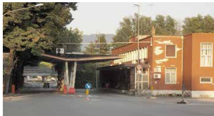
Il valico di Casa Rossa

Su un lato del piazzale Casa Rossa si estende via Emilio Cravos (6) che prende il nome dal goriziano fucilato dagli austriaci il 17 novembre 1915 perché aveva gridato "Viva l'Italia". Superato il confine ci troviamo nella località di Rozna Dolina-Valdirose . Un tempo la zona era un luogo di svago chia-