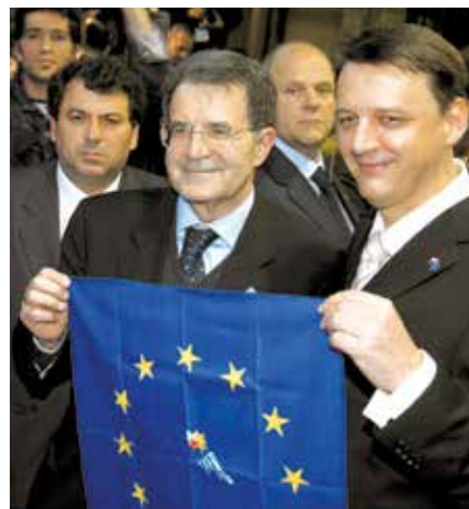
Il presidente della Commissione Ue Prodi a Gorizia nell'aprile 2004

30. aprila 2004 je Slovenija uradno vstopila v Evropsko unijo. Na Trgu Evrope / Transalpina je ob tej priložnosti potekal velik praznik, med katerim so simbolično odstranili mrežo, ki je označevala mejo. Opolnoči 20. decembra 2007 so padle še zadnje ovire, ko je Slovenija pristopila v Schengensko območje. Nova Gorica in Gorica bosta skupaj Evropska prestolnica kulture v letu 2025.