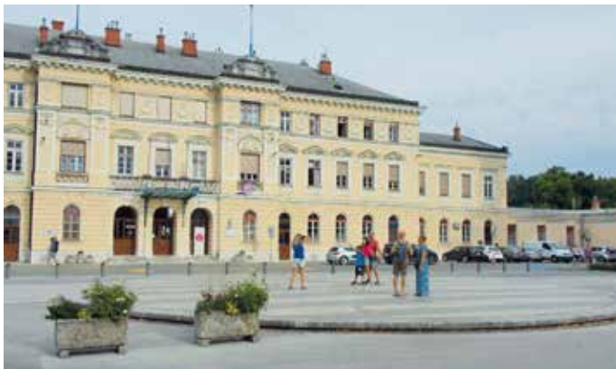
Piazza e stazione della Transalpina

Go back to the Transalpina square to reach, along Via Montesanto in Gorizia, a former refugee camp in the area of the Casermette (7) . Close to the border is the Bepon tavern (8) where, among other things, you can taste the delicious radicchio called Rosa di Gorizia, which is grown in the nearby fields and in neighbouring Solkan.