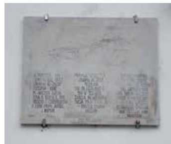
La lapide in Casa Rusjan

Return to Piazza Vittoria (1B) for the second route. Continue along Via Arcivescovado and Via Carducci up to Piazza De Amicis , then turn right onto Via Formica and you will reach Via del Rafut . The alternative is to take Via Favetti (see Itinerary 4), halfway down Via Carducci on the right, to the beginning of Via Cappella (2B) , an uphill road that crosses the border and climbs to the monastery, where the ancient cobblestones make it unique and timeless. At the beginning of the street a marble plaque commemorates the Edy and Pepi Rusjan brothers (3B) : see Itinerary 1). On reaching the top of Via Cappella, cross an olive grove to arrive at Kostanjevica (6B) .