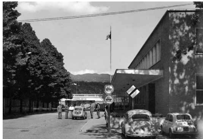
Il valico di Casa Rossa negli anni Cinquanta

Con il lasciapassare si poteva transitare solo nei valichi di seconda categoria (Rafut, San Pietro, Merna, Devetachi e Jamiano); in quelli di prima categoria solo con il passaporto.