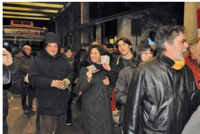
La festa per la caduta del confine il 20 dicembre 2007